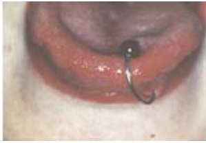
Anneau métallique dans la langue