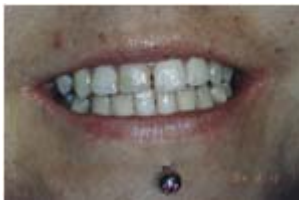
Perçage sous la lèvre inférieure