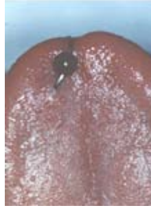
Barre linguale (barbell). Ce type de bijou est souvent à l'origine des fractures de dents.